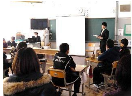
6年生 中学校説明会